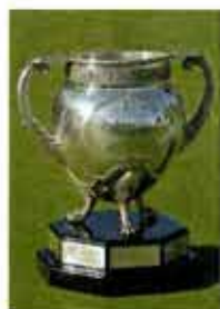
La Biarritz Cup

« Messieurs, les links du Golf Club de Biarritz sont redevables à la nature de leur sol d'un avantage précieux ; à ma connaissance, votre golf est le seul en France qui soit entièrement tracé sur un terrain sablonneux, et la pratique du jeu y est ainsi rendue possible en toute saison et par tous les temps mais... La longueur du parcours est insuffisante. Et un grand nombre de trous ne comportent qu'un drive et un pitch. Les greens sont uniformément larges et plats, avec des bunkers insuffisamment étudiés et mal tracés. Les modifications que je vous propose d'effectuer suivant les indications données sur les plans et croquis ci-joints, feraient du golf de Biarritz un des meilleurs du continent. L'évalue