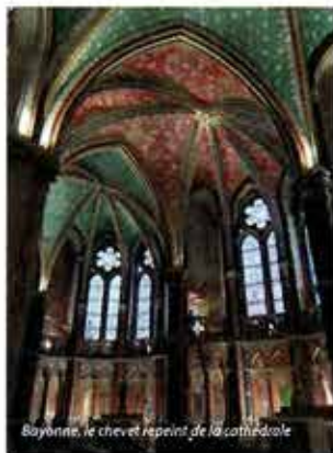
Bayonne, le chevet repeint de la cathédrale

La romaine Lapurdum est devenue Baiona (bonne rivière en basque) au X e siècle. Enrichie grâce à son port sous le règne des Plantagenêts et Alléonor d'Aquitaine. Elle vivra ensuite des conflits avec l'Espagne. Louis XIV la fera fortifier par Vauban et les vestiges de ces remparts ornent toujours la colline originelle de Bayonne. L'office de tourisme propose des visites guidées à la découverte de la cathédrale, du Musée basque, les caves gothiques ou le Château-Vieux. Et, de là, vous choisirez peut-être de visiter la côte basque ou l'intérieur des terres à la rencontre d'une culture unique.