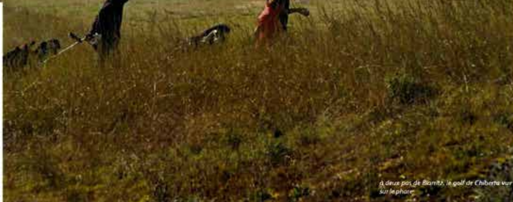
À deux pas de Biarritz, le golf de Chiberta sur le phare

voir son swing et surtout qui joue en sa compagnie. Autant dire que ses partenaires n'ont pas le droit à l'erreur.