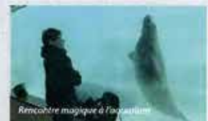
Rencontre magique à l'aquarium

Le Centre d'entraînement d'Ilbarritz a 13 ateliers sur tapis, des stalles couvertes, des aires engazonnées et pour travailler tous les aspects du jeu, quatre écoles différentes et vous pourrez choisir votre pro préféré. Formule Tracman et smart to move : 150€ pour 1h30 / 295€ pour 3 heures. Tél. : 05 59 43 81 30 www.golfilbarritz.com