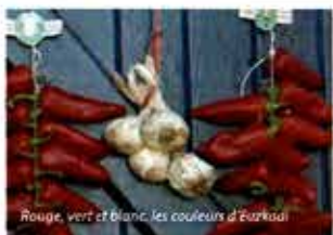
Rouge, vert et blanc, les couleurs d'Barkadi