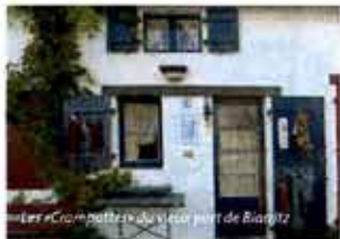
Le «Cram» à l'ancien port de Biarritz