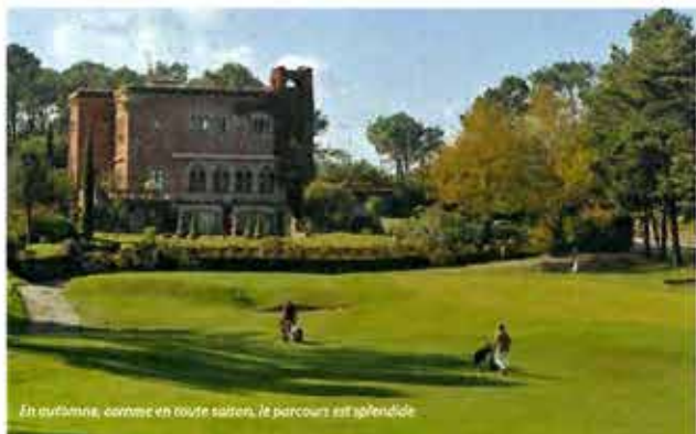
En automne, comme en toute saison, le parcours est splendide