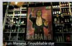
L'un Mariano, l'inoubliable star

L' Amiral (face à l'entrée 6 des halles de Biarritz) déco agréable et cuisine raffinée et abordable, entrées typiques Xipirons, tartare de truite, galette de pieds de porc pannés, poissons (cabillaud mariné) ou viandes, plat vegan. Une bonne adresse. Tout comme son voisin Chistera et coquillages qui est une excellente table.