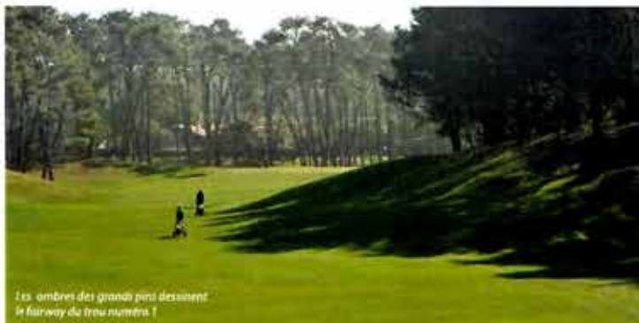
Les ombres des grands pins dessinent le fairway du trou numéro 1

Chiberta, c'est le petit frère sur la côte basque. Né dans les années trente, il affiche 40 ans de moins que Biarritz, mais sa renommée a déjà fait le tour de la planète golf. Sa particularité est de nous faire passer tous les trois ou quatre trous de la forêt à la mer et vice versa. Impossible de se lasser. On passe sans cesse du souffle iodé et puissant de l'océan aux douces brises parfumées de la pinède. Le jeu lui-même change souvent. Le danger est soit le sable de la dune, soit le sous-bois, soit le vent violent, soit l'étroitesse des fairways. Cette