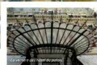
La véranda de l'hôtel de palais